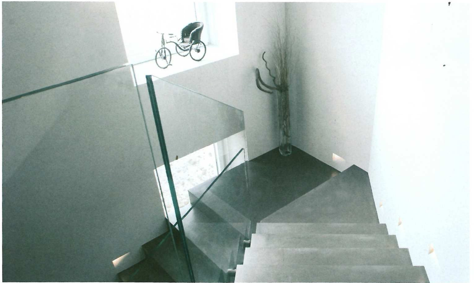
Nella pagina accanto uno scorcio della camera del figlio e degli ospiti con accessori colorati e divertenti. Sopra, la bella scala rivestita in resina color grafite collega la zona giorno e la soprastante zona notte. Sotto, a sinistra, un lampadario sferico con cristalli genera preziosi riflessi sulle pareti circostanti trattate con tinteggiature spatolate.